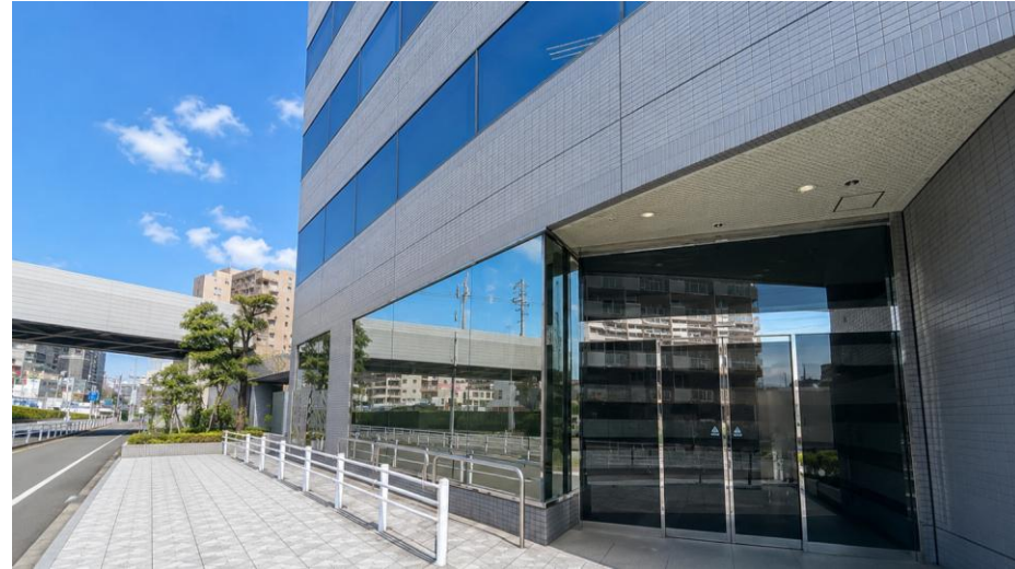
エントランス / 一時駐車スペース