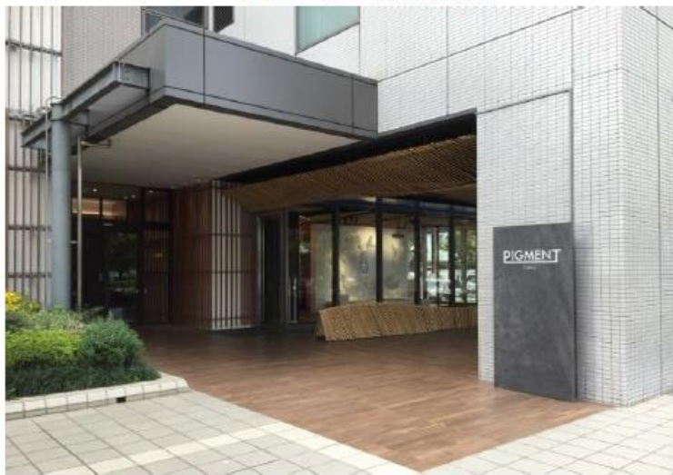
【1Fエントランス】駅からの視認性抜群